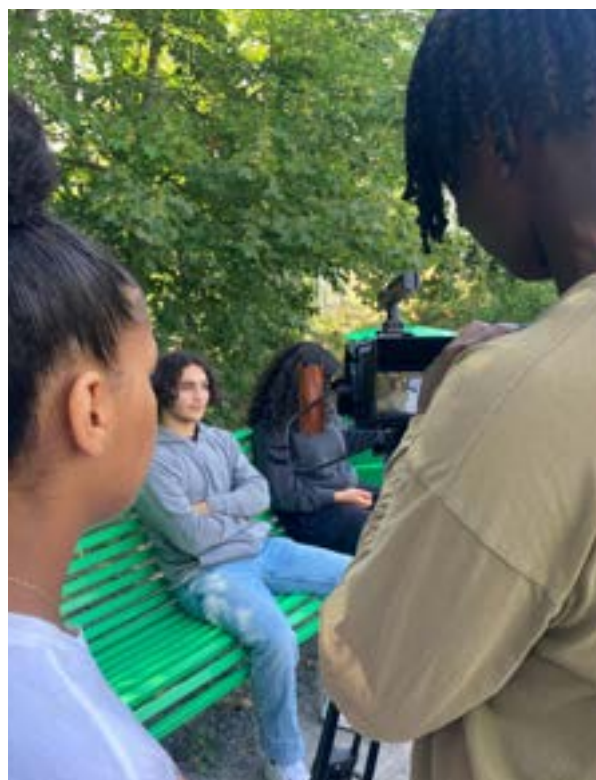
.MOV sommarjobbare 2022

Tillsammans med Kulturhuset Husby deltog vi som en av medarrangörerna till den första upplagan av Husby Konstsalong. Ansökan var öppen för alla att skicka in sina konstverk och resulterade i en välbesökt utställning under juni med ett tjugotal utställda verk i huset.