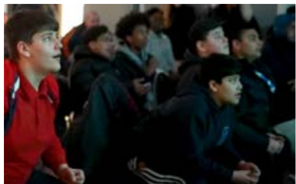
Fotbollvisning med Quaison Foundation