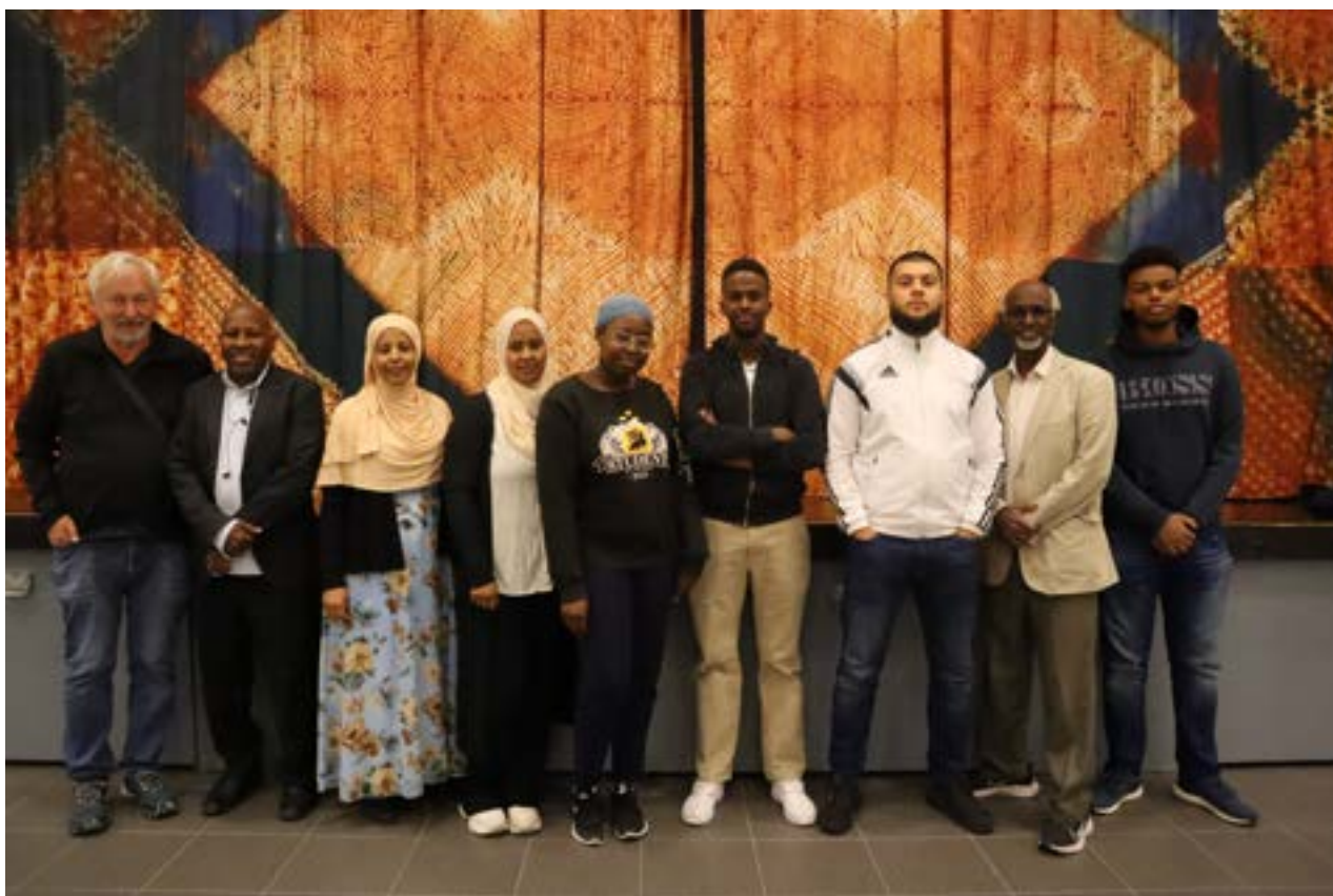
Husbyrådets ledamöter 2022-2023