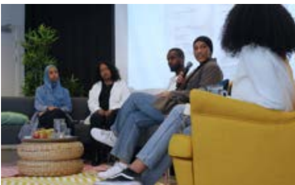
Ungdomspanel på Järva Röstar