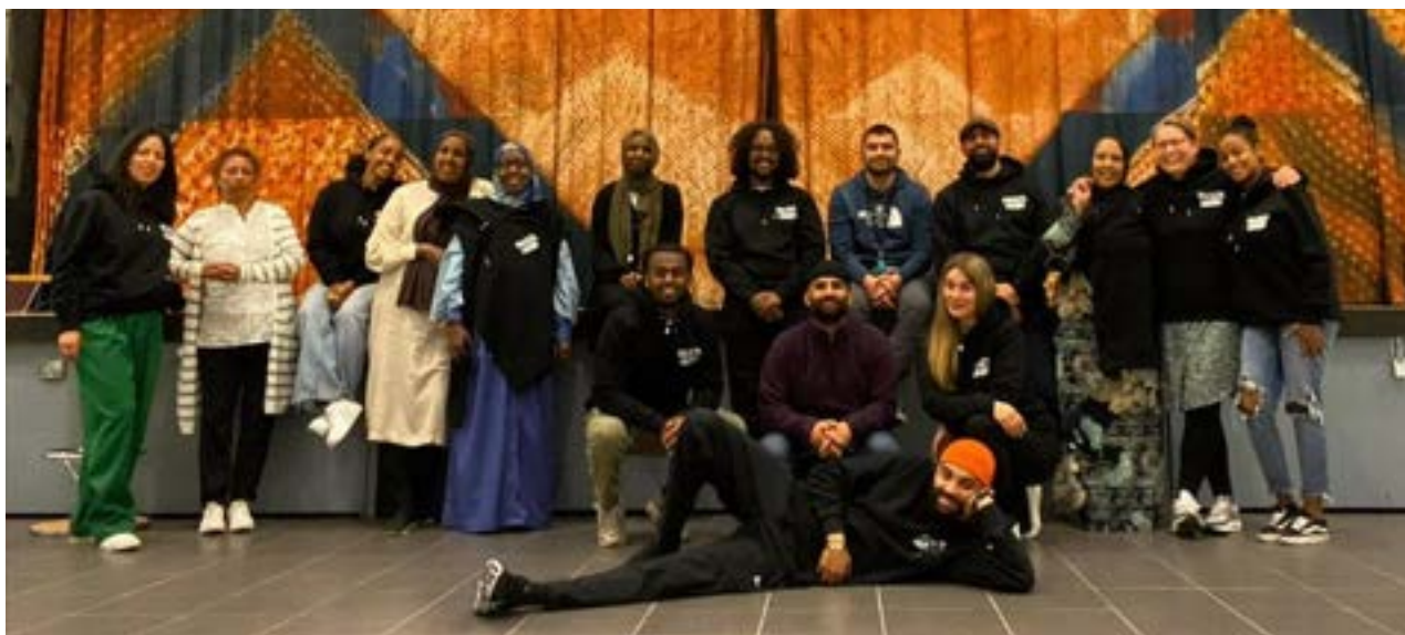
Folkets Husbys styrelse och personal 2022

Styrelsen vill rikta ett varmt tack till personalen på Folkets Husby för deras gedigna arbete under året. Vi vill även tacka våra medlemmar, samarbetspartners samt Järvabor för ett fint 2022. Vi är tacksamma över detta året, och den kraften som finns runtomkring oss. Nu tar vi oss an nya utmaningar och är uppspelta över kommande verksamhetsår.