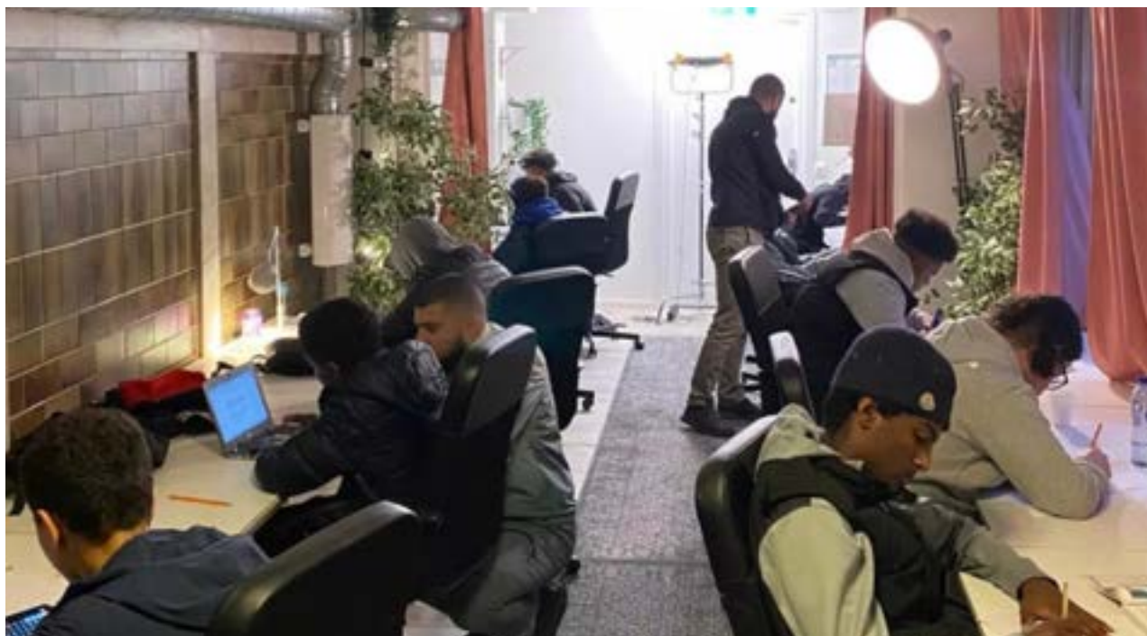
Läxhjälp i Inkubatorn drivet av Upprustningen

Under sommaren togs två omgångar av sommarjobbare emot, där en fokuserade på arbete med Trygghetsundersökningen och den andra gruppen producerade en kortfilm. En längre resa gick till Göteborg med en grupp ungdomar för att delta i ett fotbolls- och kulturarrangemang.