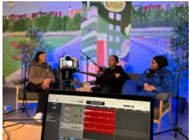
Videopodcast med Galdem A Talk