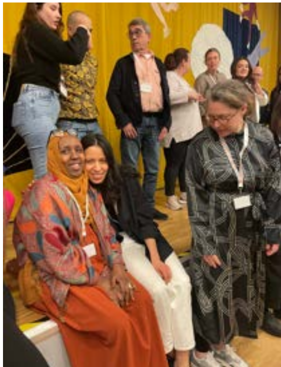
På Folkets Hus och parkers förorts nätverksträff

Folkets Hus och Parker - där Folkets Husby är en av ca 500 föreningar från hela Sverige - fortsätter att vara en viktig stödfunktion för huset i arbetsgivarfrågor och rådgivning. Under året har riksorganisationen åter öppnat för fysiska nationella träffar och Förorts nätverket samlade i augusti Folkets hus från hela Sverige.