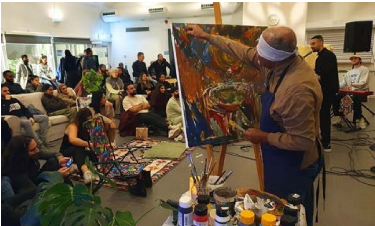
Improvisations-kväll arrangerat av Beyn2

Genom samverkan med konstkollektivet Beyn2 arrangerades under hösten en välbesökt improvisations-kväll där stora salen omvandlades till ett stort vardagsrum och lokala kreatörer välkomnades att delta. Studion i Folkets Husby gick under året över i egen regi efter att ha drivits ihop med ABF Stockholm. Övergången var smidig och vi har fortsatt tillhandahålla kostnadsfri studiotid. Flera grupper har börjat video-podda i huset vilket har varit en effekt av inköpt ny utrustning.