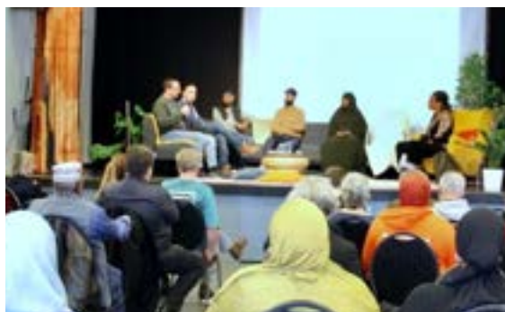
Järva Röstar 2022, Foto: Lima Habib

En verksamhet som tar plats varje tisdag kväll i huset är Socialt Center, där flera olika medlemsföreningar och initiativ gått samman och hyr in sig för juridiskt, socialt och arbetsrättsligt stöd. Här organiserar sig även boende som är missnöjda med sin hyresvärd. Under året har även utdelning av matkassar startat vilket är mycket efterfrågat och uppskattat.