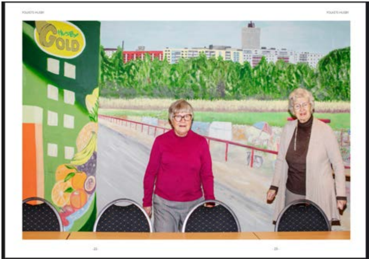
Ur rapporten Dela rum - gemensamhetslokalen och samhället

En viktig del av Folkets Husbys verksamhet är att lyfta och synliggöra den kunskap som alstras i huset och de erfarenheter som sällan tar plats. Under året har vi föreläst och tagit emot studenter och forskare från bl a Södertörns Högskola, KTH Arkitekturskolan och Dalslands folkhögskola. Även tjänstemän och politiker från bl a Jönköping, Nyköping och Upplands-Bro har förlagt studiebesök till huset för att lära av erfarenheterna kring att bygga en framgångsrik medborgardriven mötesplats.