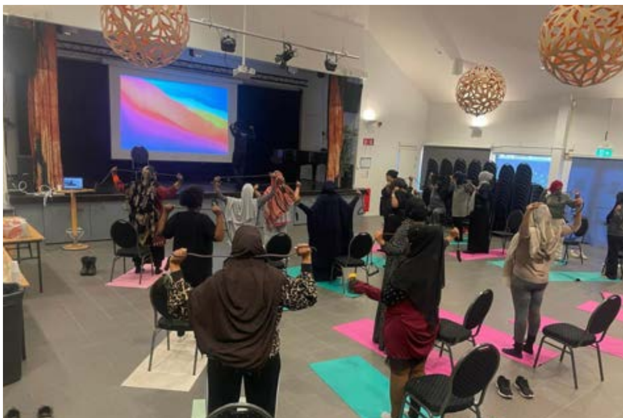
Träffar för kvinnor med föreningen Existera, Foto: Existera

Välmåendet har främjats genom en ökad satsning på öppna hälsofrämjande aktiviteter i huset.