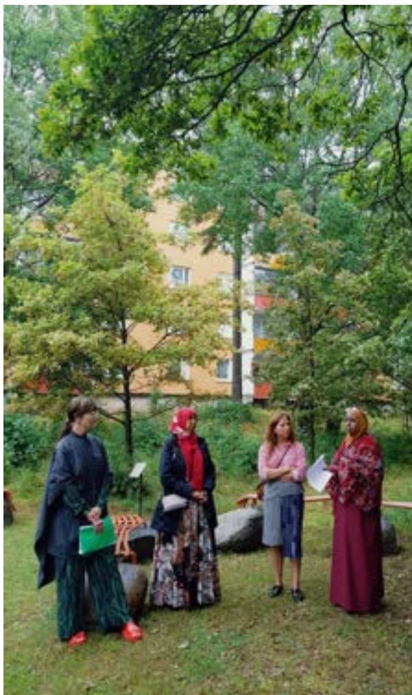
Invigning av ljudkonst i Husby Gård

Under 2022 riktades fokus på att utveckla en riktad satsning mot filmskapande i Folkets Husby. Med mottot Från idé till premiär sattes en struktur för filmplattformen .MOV, där unga fått coachning från en första nyfikenhet på att göra film, genom manus och gratis utlåning av högkvalitativ utrustning till produktion av kortfilm. Cirkeln slöts med en stor filmfestival i början av 2023 där nio kortfilmer tävlade om Getpriset. Den fullsatta kvällen inspirerade i sin tur andra unga att förverkliga sina idéer till nästa års festival.