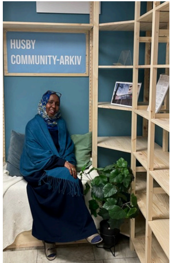
Byggnation av Husby Community-arkiv