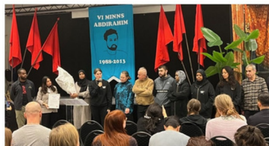
Folkets Husby tog emot Abdipriset 2024.

Abdipriset delas ut till minne av Abdi, som växte upp i Husby och dödades under ett besök i Somalia i augusti 2013.