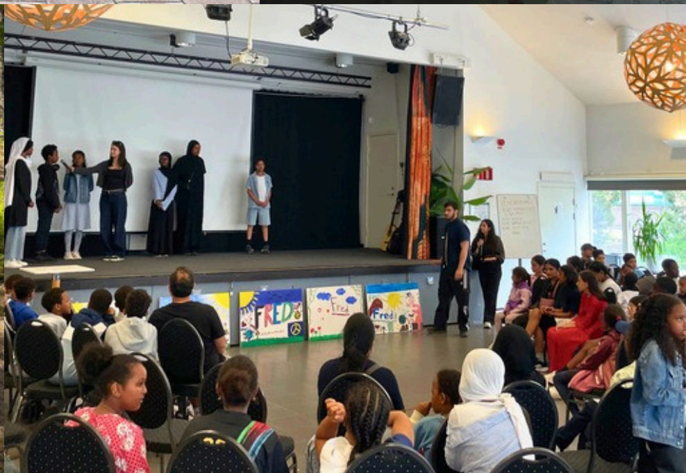
Arbetsgrupp av föreningar framför Kvarnbacka-lokalen, Yoga för äldre, friluftsgårdsaktivitet med Inkubatorn, Hoppets Vingar kolloavslutning med teater