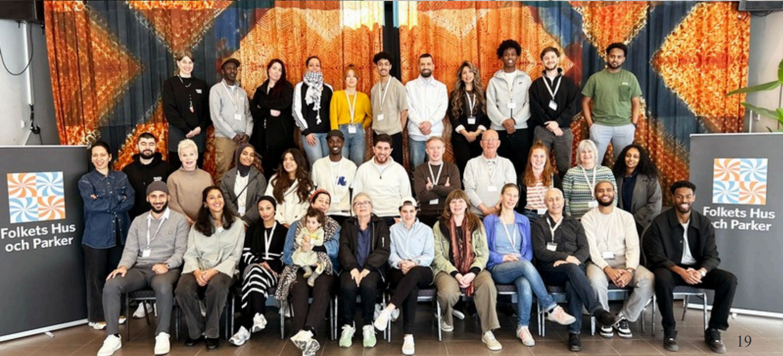
Från övre vänstra hörn: Nätverket-konferens, UR-serie, forskningscirkel på besök i Malmö, Förortsnätverket samlat i Husby, utbytesstudenter från Rikkyo University