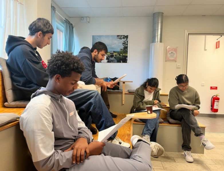
Hoppets vingar planering inför kollo

Inkubatorn, Folkets Husbys plats för unga 18-30 år, fortsätter att vara en möjliggörare för unga framförallt efter gymnasieåldern. Här studerar och arbetar unga från området under dagtid och får vid behov praktiskt stöd. Det är en öppen plats för studier och idéutveckling, där ideella initiativ och föreningar tar avstamp. Föreningen Upprustningen har med sin bas i huset fortsatt med både bokcirkel-verksamhet, nattvandringar och att bedriva läxhjälp och coachning för en yngre målgrupp.