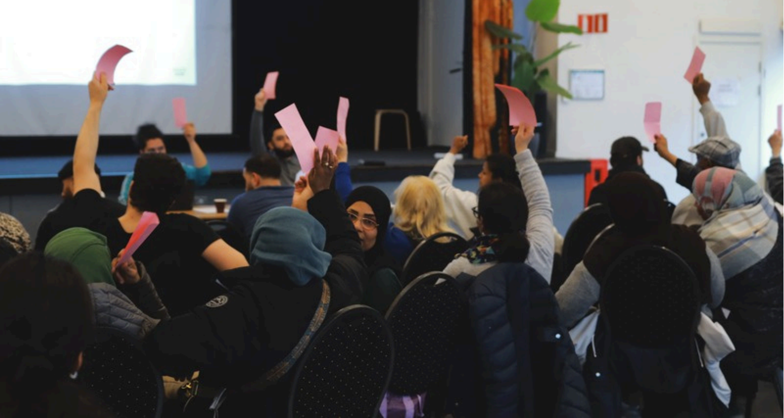
Röstning under Folkets Husbys årsmöte 2025