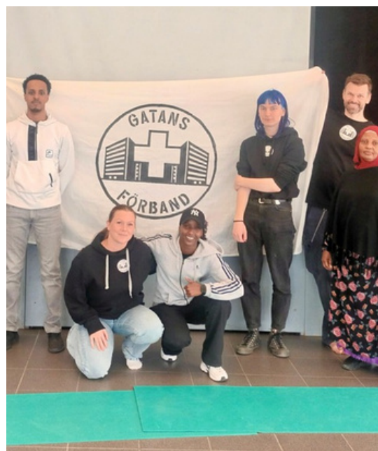
Instruktörer från Skyddsnetet med aktiva i Gatans Förband

Frukostklubben där vi tillsammans med Rädda Barnen erbjudit unga i grundskoleåldern frukost två mornar i veckan innan skoltid har samlat allt mer unga och under loven omvandlats till brunchklubbar med aktiviteter.